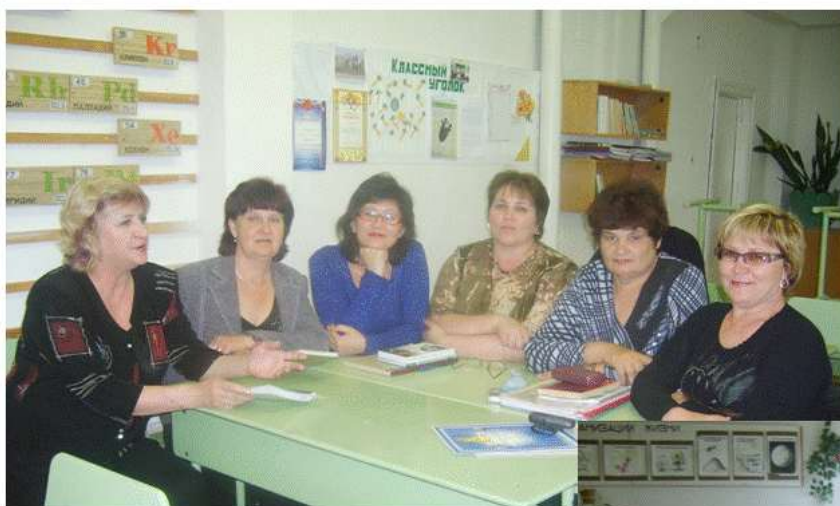
ОДНО ИЗ ЗАСЕДАНИЙ КРУЖКА ПРАВОВЫХ ЗНАНИЙ «ХОЧУ ВСЁ ЗНАТЬ »